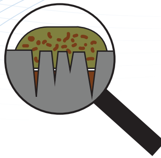
Bevochtiging met 'klassieke' reinigingsproducten